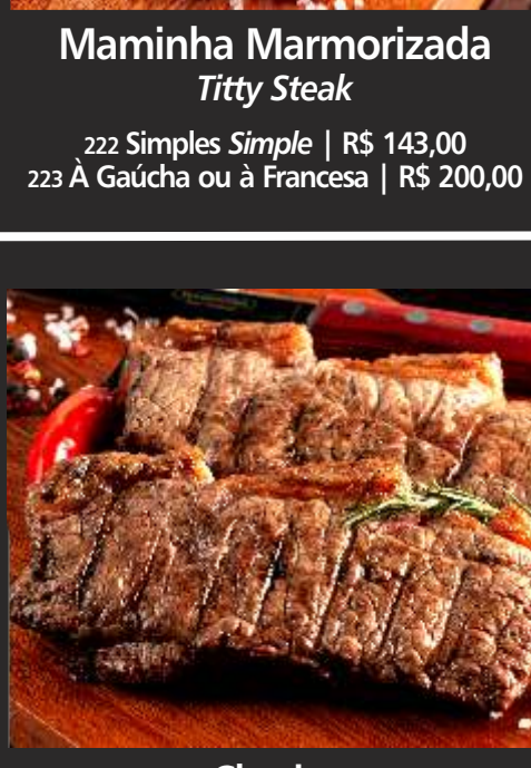
Maminha Marmorizada Titty Steak

222 Simples Simple | R$ 143,00 223 À Gaúcha ou à Francesa | R$ 200,00